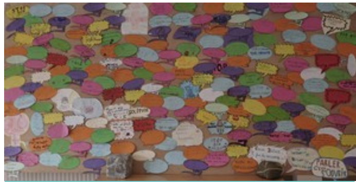
Le panneau actuellement exposé au restaurant scolaire

Pourquoi faire ce type d'action ? Cela permet de faire participer les élèves ; de plus, cela les sensibilise bien à cette question.