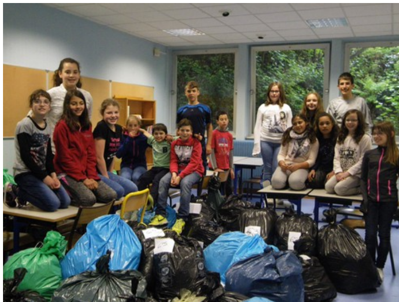
La classe de 6e3 avec les sacs de vêtements collectés : 320kg pour cette seule classe !