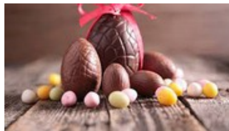
Héloïse Bonnet 4B